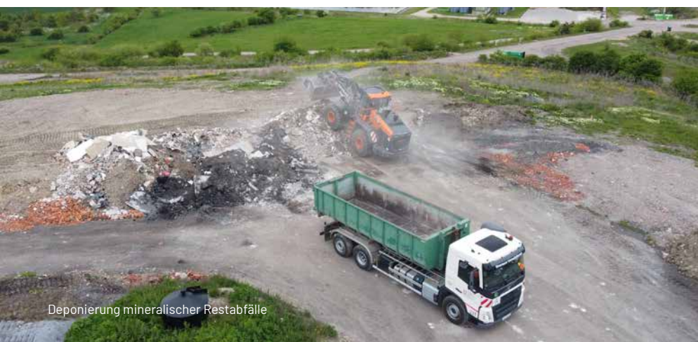
Deponierung mineralischer Restabfälle

Ihnen offen. Jede Entscheidung zählt – und gemeinsam gestalten wir eine saubere, lebenswerte Zukunft für Mittelthüringen. Machen Sie den Unterschied: Ihre Beteiligung ist der Schlüssel zum Erfolg!