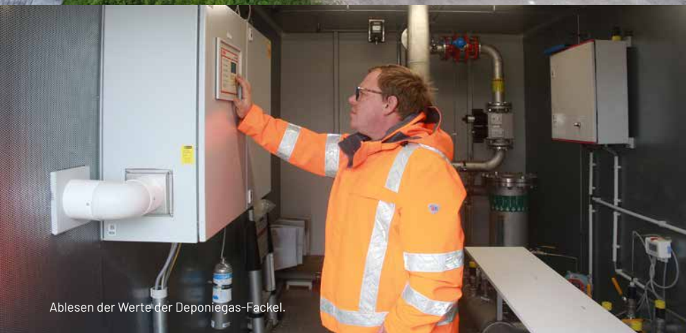
AbleSEN der Werte der Deponiegas-Fackel.